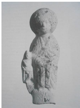
Moedergodin beeldje met een kleine staande figuur, rond 200 n. chr., gevonden bij Valkenburg

In de streek waar Lug werd vereerd zijn inderdaad flink wat terracotta beeldjes van Godinnen of fragmenten daarvan (allen van rond 200 AD) gevonden. Dit soort beeldjes is gevonden in heel West Europa, en ook in het Rijnland bij de limes . In Den Haag, bijvoorbeeld, zijn in de 80er jaren van de vorige eeuw diverse fragmenten van dit soort beeldjes, vrijwel allemaal van Godinnen, gevonden. 30 Een zeer interessante vondst komt uit