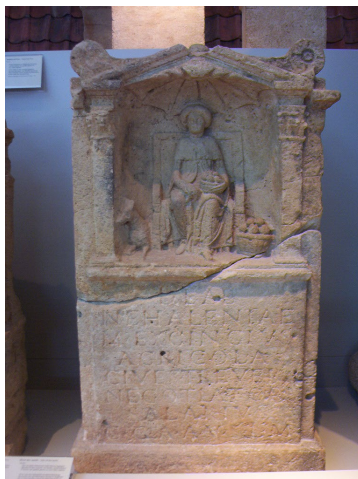
Altaarbeeld van de Godin Nehalennia, rond 200 na chr.

Bij de Nehalennia tempels in Zeeland werden ook diverse mannelijke Goden vereerd, in het bijzonder Neptunus en Hercules, maar de God Mercurius blijkt daar niet belangrijk te zijn geweest. Hij werd zelden afgebeeld op de zijkant van de Nehalennia altaarbeelden. Er is meer bewijs van de Mercurius verering op andere locaties in de Lage Landen (die