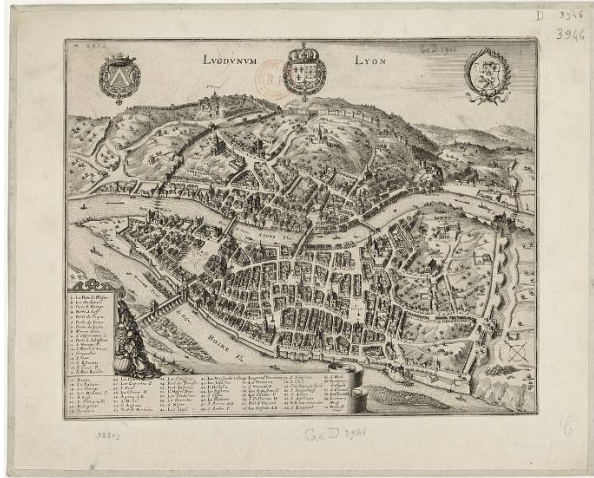
Één van de andere Lugdunums: Lyon, op een 17 e eeuwse kaart

Soms is Mercurius gelijkgesteld met de Germaanse God Wodan. Maar we weten dat de Germaanse verering van Wodan West Europa pas bereikte in de tweede en derde eeuw na Chr. en de kuststreken van Nederland pas in de vijfde eeuw. En het is daarnaast ook duidelijk geworden (door taalkundig en archeologisch onderzoek) dat tot de periode van de Romeinse invasie er zeer waarschijnlijk een Keltische cultuur heeft bestaan in de Nederlandse kuststreek. Volgens de keltoloog Laurant Toorians zijn er aanwijzingen dat de bewoners van de Nederlandse kust ooit ‘Noordzeekeltisch’ hebben gesproken, hetgeen ook suggereert dat de cultuur in dit gebied een Keltisch geweest kan zijn. 3 Als dit het geval is geweest, dan wordt het heel denkbaar dat de inheemse bewoners van die streek Lug kunnen hebben vereerd. 4