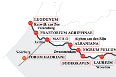
De nederzettingen langs de Romeinse limes, met de corresponderende namen van de huidige plaatsen

Laat ik beginnen met Lugdunum. Zoals gezegd, wijst de aanwezigheid van de nederzetting Lugdunum in het Rijnland en het feit dat Lug werd vereerd in de hele Keltische wereld, erop dat Lug vereerd moet zijn door alle mensen die in deze regio hebben geleefd, dus niet alleen op de exacte plek waar de nederzetting eens moet hebben gestaan. Dit betekent