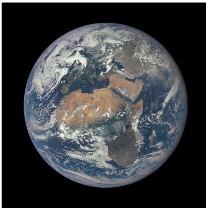
Afrika gezien vanuit de ruimte

en ook wat het betekent om er diep verbonden mee te zijn. Duizenden jaren lang hebben mensen hard gevochten in conflicten en oorlogen, vaak in afgelegen gebieden waar ze kennelijk de aanwezigheid van de prachtige landschappen om hen heen niet opmerkten of voelden – en waaraan ze in hun onwetendheid zelfs enorme schade aanrichtten. Helaas gaat dit vandaag de dag nog steeds door. De soldaten hebben zich zo sterk gericht op het vinden en bestrijden van de vijand, dat ze in hun vijandige mindset hun gevoeligheid voor de aanwezigheid en de kracht van het omringende landschap, van de meer-dan-menselijke wereld, blijkbaar hebben geblokkeerd.