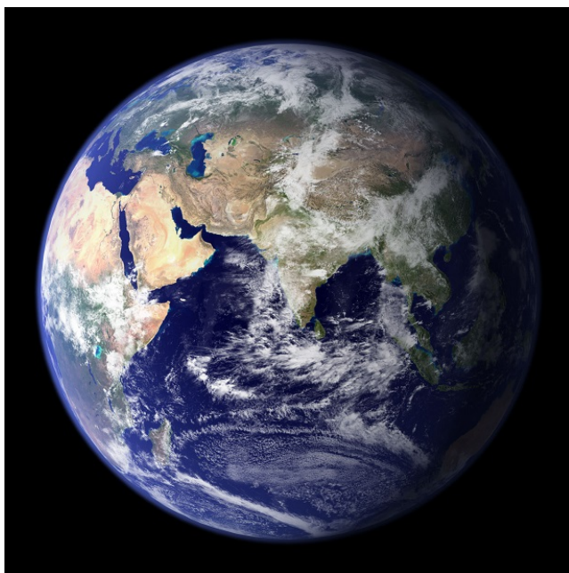
Azië gezien vanuit de ruimte

opgenomen in het omringende landschap, omarmd en verzorgd door een gigantische onzichtbare Matrix of Baarmoeder, waarin ze potentieel konden groeien tot volwassenheid. Daarom is het oudste spirituele erfgoed van onze voorouders een Godinnenerfgoed geweest; en we moeten daarbij onderkennen dat in dit erfgoed de Godin oorspronkelijk nog niet menselijk was vormgegeven, nog non-antropomorf was.