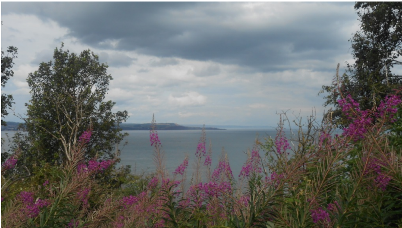
De kust van Devon, Engeland, vlakbij Dawlish