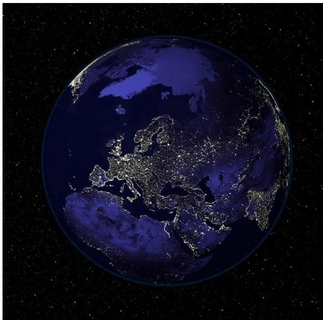
Europa, 's nachts gezien vanuit de ruimte gezien

nog niet voorbij. Populistische politici weigeren het oude verhaal op te geven en, aangedreven door de ingebeelde ‘veiligheid’ van hun gepolariseerde wereldbeeld, blazen ze het zelfs op tot enorme proporties, voornamelijk omdat ze zich bedreigd voelen door de onomkeerbare opkomst van het open, mondiale wereldbeeld. Ze verheffen hun stem, worden militanter en proberen een leger van toegewijde volgers te verzamelen. Ze maken deel uit van een tegenbeweging, die de confrontatie zoekt met iedereen die te dicht bij hen durft te komen, gedreven door haar onweerstaanbare, dualistische drang om met andere groepen mensen te strijden en te proberen hen te verslaan. We zijn er getuige van dat populistische zich in toenemende mate vastklampen aan steeds absurdere en gevaarlijkere samenzweringstheorieën.