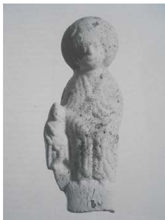
Moedergodin beeldje met een kleine staande figuur, rond 200 n. chr., gevonden bij Valkenburg

In de streek waar Lug werd vereerd zijn inderdaad flink wat terracotta beeldjes van Godinnen of fragmenten daarvan (allen van rond 200 AD) gevonden. Dit soort beeldjes is gevonden in heel West Europa, en ook in het Rijnland bij de limes . In Den Haag, bijvoorbeeld, zijn in de 80er jaren van de vorige eeuw diverse fragmenten van dit soort beeldjes, vrijwel allemaal van Godinnen, gevonden. 30 Een zeer interessante vondst komt uit