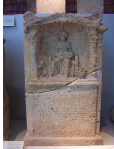
Altaarbeeld van de Godin Nehalennia, rond 200 na chr.

Bij de Nehalennia tempels in Zeeland werden ook diverse mannelijke Goden vereerd, in het bijzonder Neptunus en Hercules, maar de God Mercurius blijkt daar niet belangrijk te zijn geweest. Hij werd zelden afgebeeld op de zijkant van de Nehalennia altaarbeelden. Er is meer bewijs van de Mercurius verering op andere locaties in de Lage Landen (die